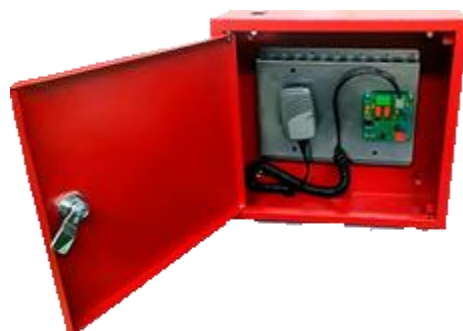
מיקרופון רחוק GERM